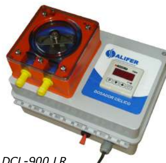
Dosador DCL-900 LR

Aplicações: Tratamento de água em caldeiras, torres de resfriamento, piscinas, caixas de gordura, lubrificação de esteiras, entre outros.